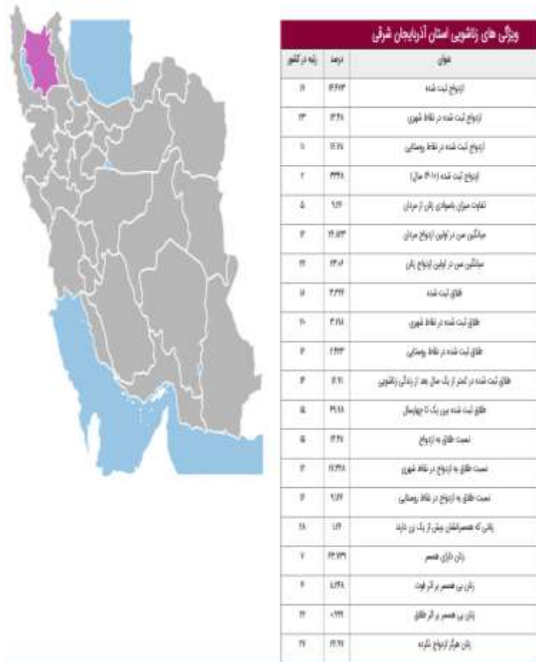
جدول ۲: ویژگی‌های زناشویی استان آذربایجان شرقی در سال ۱۳۹۶