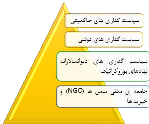
نمودار ۲: گونه‌شناسی جزئی سیاست‌گذاری‌های داخلی پیرامون کودک در ایران